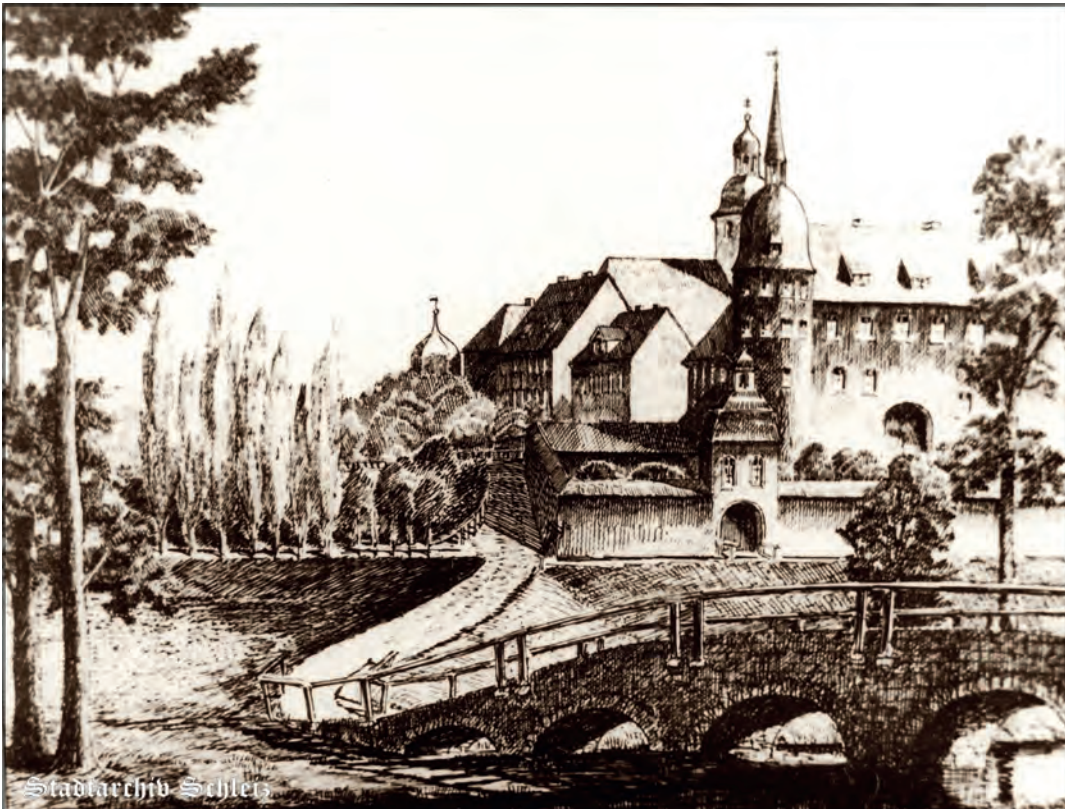
Foto: Louisenburg vor dem Brand 1837, gesehen aus Richtung Wisenta