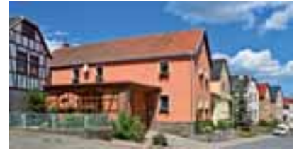
Möschlitz, Ziegenrücker Straße