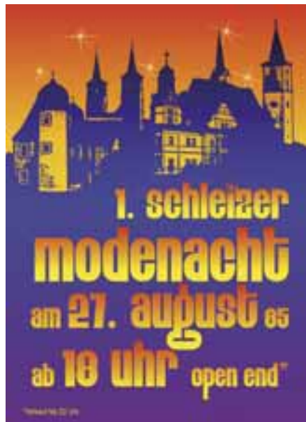
Flyer der ersten Schleizer Modenacht 2005

Am 30. August wird die 10. Schleizer Modenacht vom WEKA-Kaufhaus um 17.00 Uhr in der Teichstraße in Schleiz eröffnet. Erstmals wird die Teichstraße zwischen Markt und Poststraße und verlängerte Bahnhofstraße von der Schleizer Landbäckerei bis zur Teichstraße für den