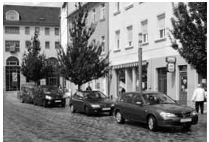
Alle diese Fahrzeuge parken in der falschen Fahrtrichtung.

Daher darf gemäß StVO auf den Parkflächen an der östlichen Neumarktseite zwischen dem WEKA-Kaufhaus und Spielwaren Fichtelmann nur in Fahrtrichtung zur Ausfahrt auf die Bundesstraße 94 geparkt werden.