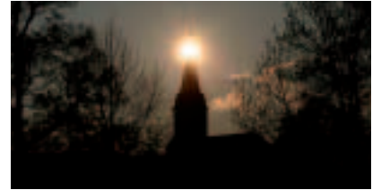
Möschlitzer Kirche bei Abendsonne