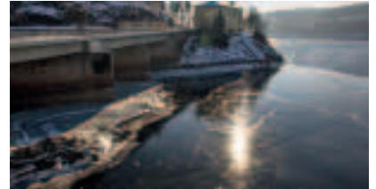
Gräfenwarth – Winter am Strausee