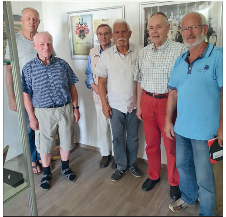
Die AG Dudenker im Rutheneum

Das Museum ist Mittwochs und Samstags von 15.00 Uhr bis 17.00 Uhr geöffnet. Die Sonderausstellung über das Brauwesen ist für etwa ein Jahr zu sehen, danach haben die Dudenker bereits Ideen für weitere Sonderausstellungen.