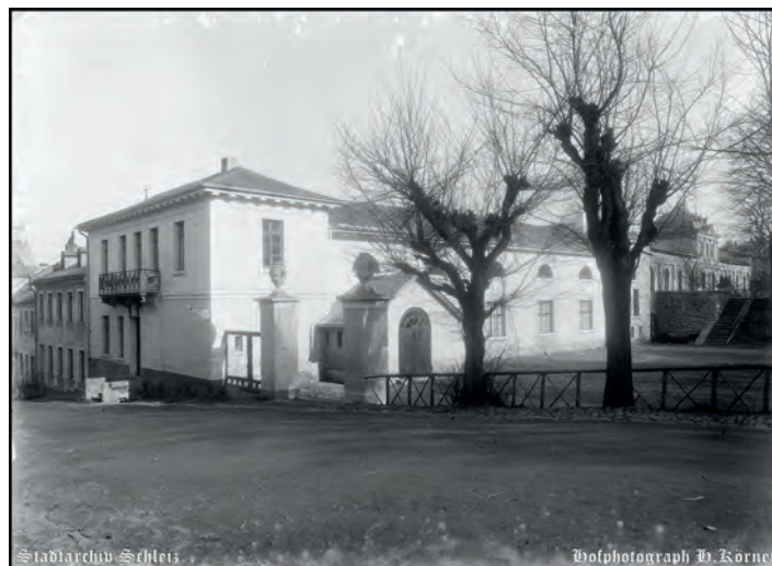
Turnerheim, früher Reithalle in der Pahlhornstraße, zerstört 1945