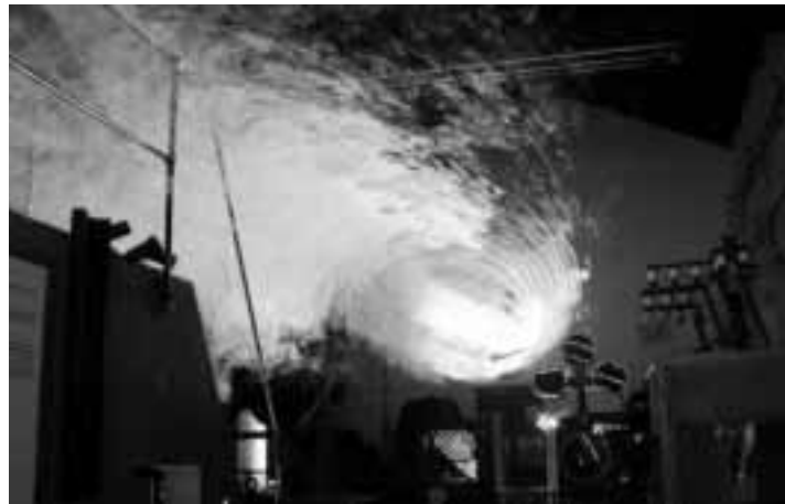
Text und Foto: Sören Kube und Andreas Schmidt