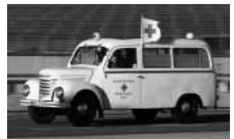
DRK-Oldtimer-Framo 901

Hanomag, Framo, B1000) gute Plätze belegen. Auch die Fahrzeugausstellung zur IAA und AMI waren Besuchermagneten vieler internationaler Gäste. Dies sei immer wieder ein Ansporn gewesen zum Erhalt der DRK-Oldtimer als technisches Kulturgut.