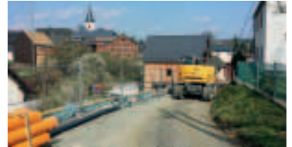
Möschlitz – Schleizleite