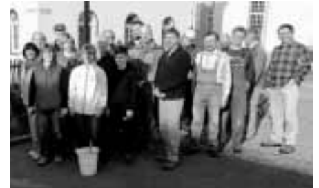
Viele engagierte Mitbürger im Ortsteil Gräfenwarth