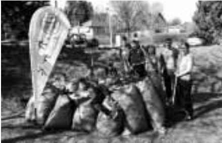
Engagierte Bürger beim Frühjahrsputz an der STAR Tankstelle

Am 1. April folgten zahlreiche Bürgerinnen und Bürger meinem Aufruf und befreiten die Stadt und ihre Ortsteile vom Winterschmutz. Laub, Unkraut, herunter-