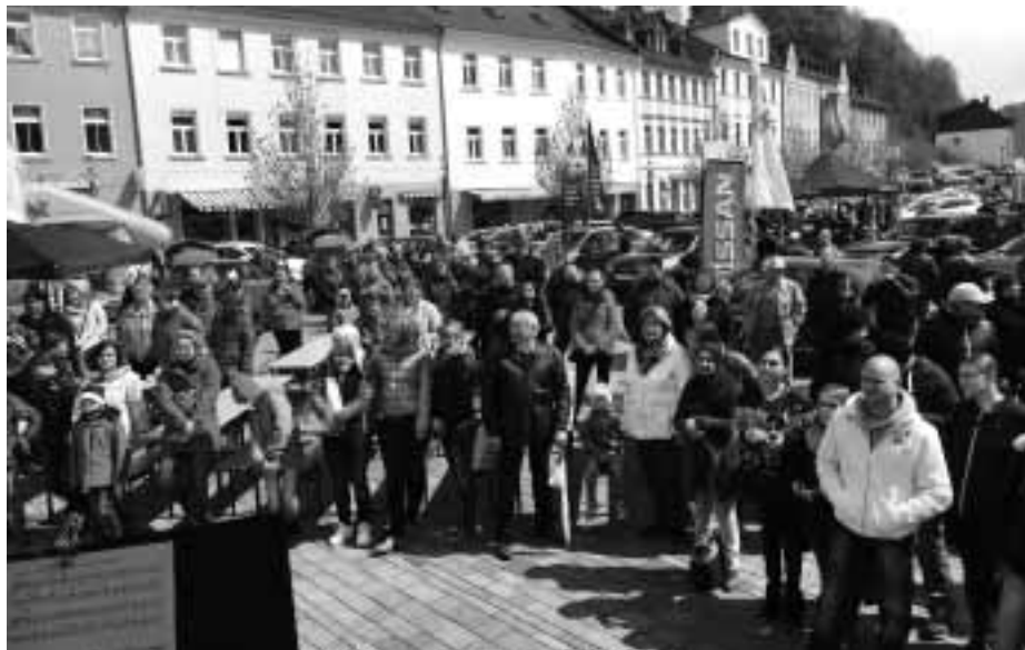
Schleizer Autofrühling im Jahr 2016

Möglichkeit, bei der Tombola, an der sich die verschiedenen Aussteller beteiligen, hochwertige Preise zu gewinnen. Der gesamte Erlös geht wieder an ein Jugendprojekt in Schleiz.