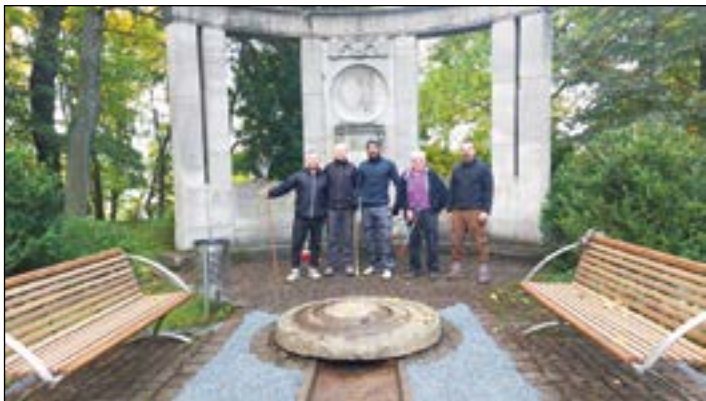
Arbeitseinsatz Denkmal Schlosspark

Die Stadt Schleiz kennt nicht nur Geschichten, sie hat Geschichte, die aber immer noch im Verborgenen schlummert und kaum Beachtung durch die eigene Bevölkerung erhält. Der Zustand des Schlossparkes wurde in den vergangenen Jahren immer schlechter, da die Wegabgrenzungen durch Pflastersteine mit Gras zugewachsen sind und die Wege sich mit Gras bedecken. Büsche breiteten sich aus und eine Parkstruktur nach historischem Vorbild mit freiem Blick zum Schloss ist nicht erkennbar. Um das Residenzschloss zu Schleiz der Öffentlichkeit bekannter und ansehenswerter darzustellen hat sich ein Freundeskreis - Das Residenzschloss zu Schleiz- gebildet.