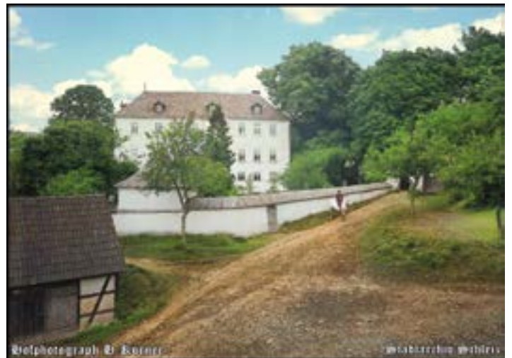
Foto: Crispendorf Schloss um 1910 (nachcoloriert)

Erzählung aus der vaterländischen Geschichte gefunden von Ingo Möckel