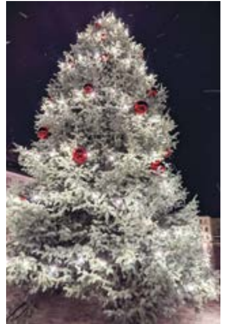
Die Weihnachtsbeleuchtung wurde vollständig auf LED umgerüstet.

Der weltpolitischen Lage und der Knappheit an Energie trägt auch die Stadtverwaltung Schleiz bei der Durchführung des diesjährigen Weihnachtsmarktes Rechnung. Auch mit Blick auf die Weihnachtsbeleuchtung im Stadtgebiet gibt es in diesem Jahr eine bewusste Entscheidung, auf diese nicht zu verzichten, jedoch ebenfalls Einsparungen und Modernisierungen vorzunehmen. So wird es erstmals im gesamten Stadtgebiet ausschließlich LED-Beleuchtung geben. Im Jahr 2022 sind alle 32 Stern-