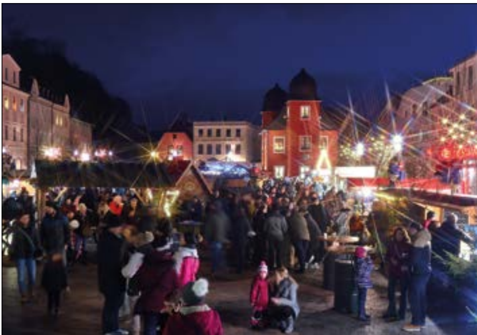
Nach zwei Jahren Pause locken an drei Tagen rund 20 Händler und ein abwechslungsreiches Programm auf der Bühne zahlreiche Besucher auf den Schleizer Neumarkt.