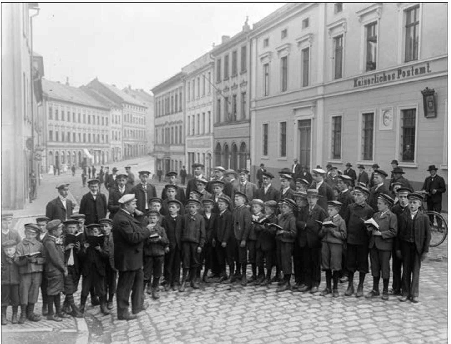
Foto: Poststraße Ecke Schmiedestraße, Schülersingchor Schleiz, Hofphotograph H. Körner

Gefunden im Stadtarchiv Schleiz im „Reußischen Erzähler“ 1925 von Ingo Möckel