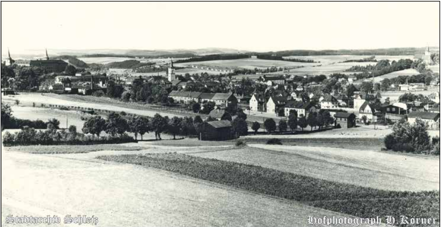
Blick vom Schützenhaus um 1926 fotografiert von Hofphotograph Heinrich Körner

Gefunden im Stadtarchiv Schleiz im „Der Oberlandbote“ September 1956 von Ingo Möckel