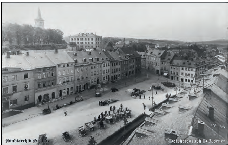
Foto: Markt um 1910 vom Rathausurm fotografiert von Hofphotograph Heinrich Körner

Gefunden im Stadtarchiv Schleiz in „Reußischer Erzähler“ 1931 von Ingo Möckel