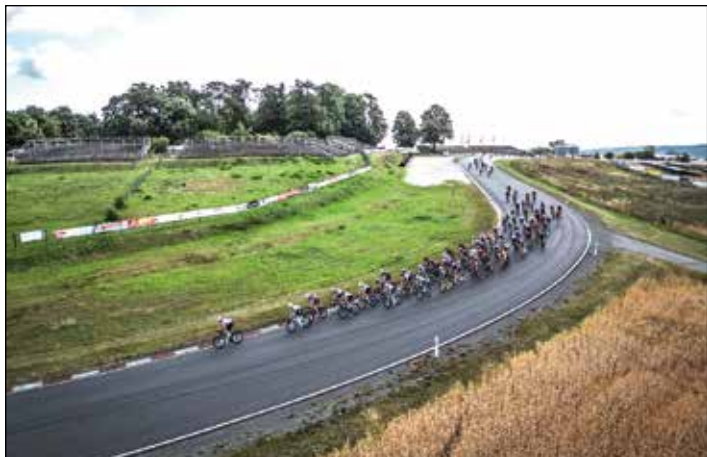
Foto: Schleizer Dreieck Jedermann: Das 13. Schleizer Dreieck Jedermann verbindet am 14. Juli 2024 das traditionelle Radrennen über die drei verschiedenen Distanzen mit einem Tag der Vereine.

Das Jahr 2024 ist noch jung, doch bereits jetzt laufen die Vorbereitungen für eine Vielzahl von Veranstaltungen in den kommenden Monaten auf Hochtouren. Am 6. April öffnet die motorwelt Schleizer Dreieck mit neuen Ausstellungsstücken wieder ihre Türen und ebenfalls am 6. April findet der traditionelle Frühjahrsputz in Schleiz und den Ortsteilen statt. Genauere Informationen hierzu folgen zu einem späteren Zeitpunkt. Der erste Bücherflohmarkt im Jahr 2024 findet am 27. April in der Stadtbibliothek Schleiz statt.