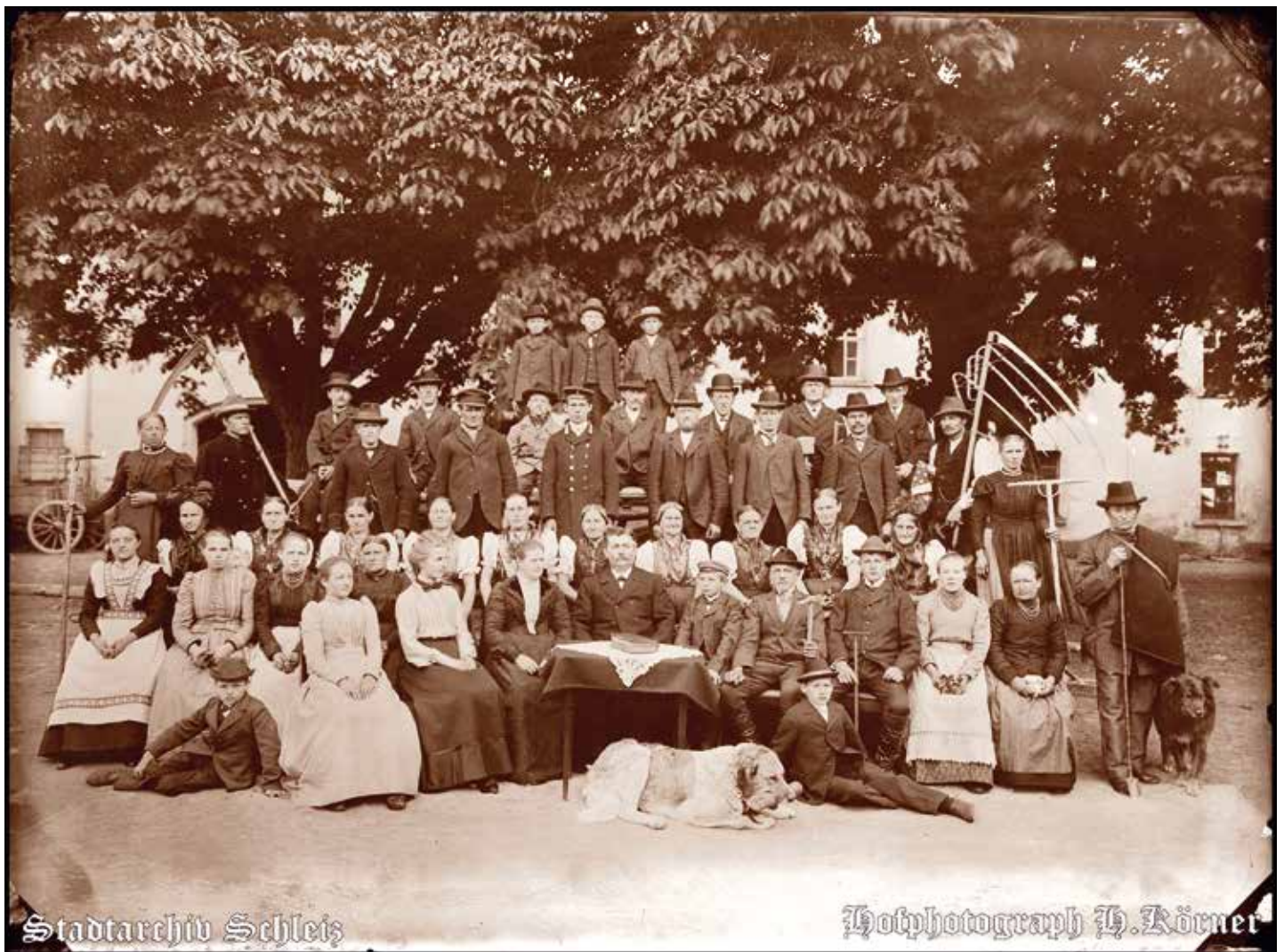
Foto: Das im Artikel beschriebene Bild befindet sich im Stadtarchiv Schleiz und kann unter archiv.schleiz.de bester Qualität besichtigt werden

Gefunden im Stadtarchiv Schleiz in „Schleizer Zeitung“ 1903 Nr. 149 von Ingo Möckel