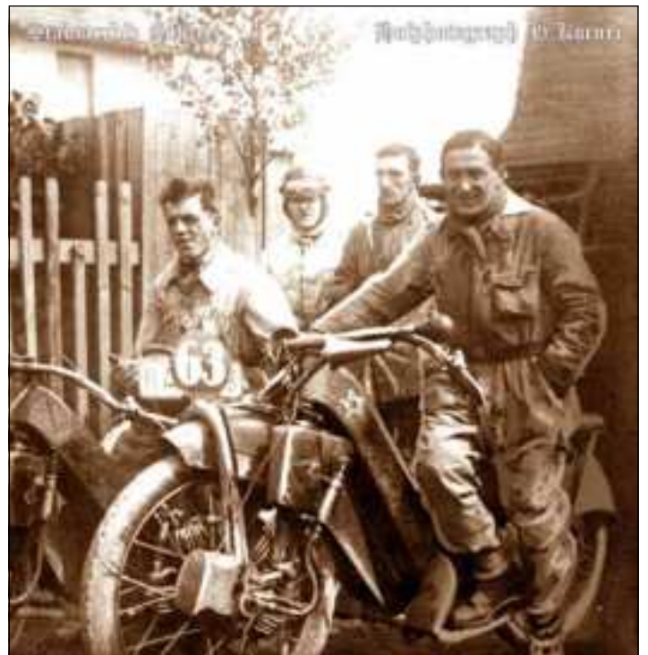
Foto: Toni Bauhofer mit Vorderradmotor- Megola

Gefunden von Ingo Möckel im Programm „Zum 10. Rennen am Schleizer Dreieck 1953“