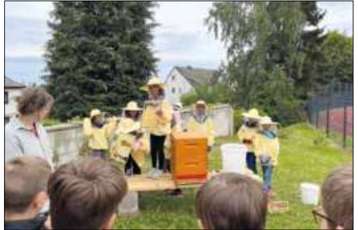
Die Kinder der Imker-AG erklären ihren MitschülerInnen, wie ein Bienenstock aufgebaut ist.