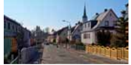
Schleiz – Nordstraße