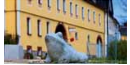
Gräfenwarth – Krötenbach