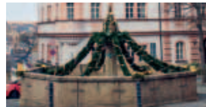
Schleiz – Osterbrunnen