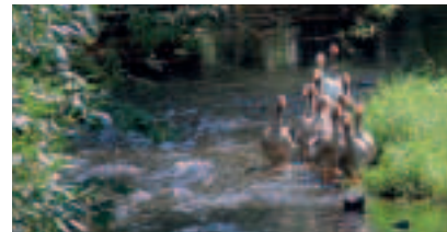
Wisentaidyle in Möschlitz