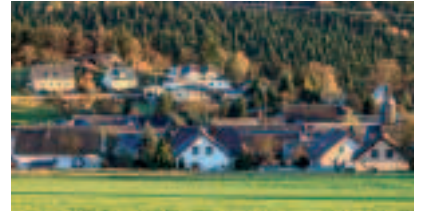
Blick auf Gräfenwarth