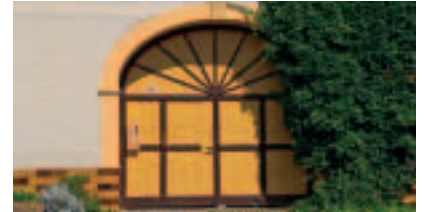
Lössau – Typisches Hoftor oberländisches Hoftor