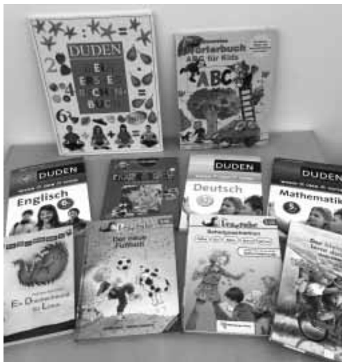
Auswahl an Büchern im Themenmonat „Das neue Schuljahr“

Kommt einfach in der Stadtbibliothek Schleiz vorbei.