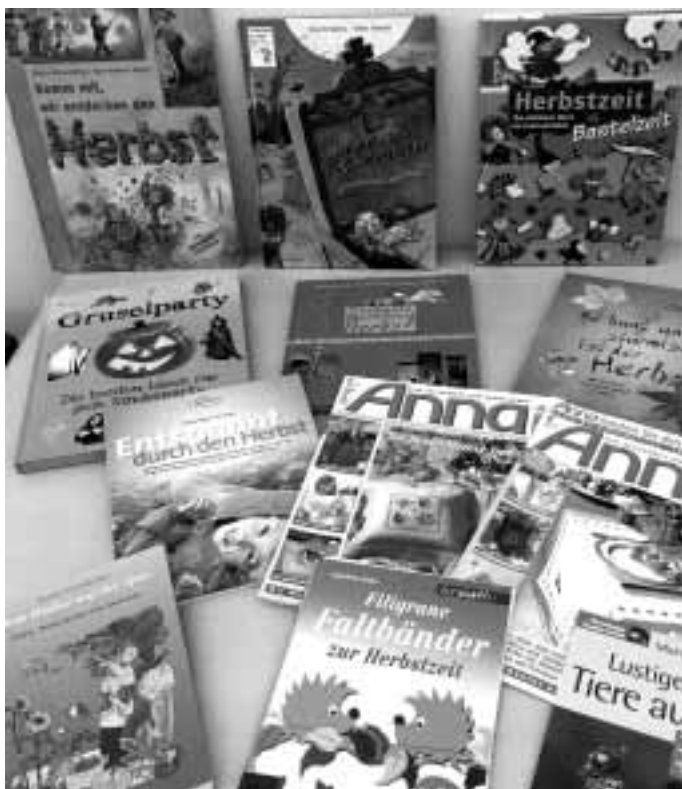
Auswahl an Büchern im Themenmonat „Herbstzeit-Bastelzeit“

Die Tage werden merklich kürzer, das Wetter noch unbeständiger, als es ohnehin schon war, die Bäume kleiden sich in bunte Kleider. Überall Kastanien, Eicheln, Hagebutten. Es wird wieder Zeit für ausgiebige Bastelnachmittage! Wir haben ein paar passende Bücher dafür heraus gesucht. Wer sich schon auf seine Halloweenparty vorbereiten will, kommt bei uns natürlich ebenfalls nicht zu kurz. Auch die ein oder andere Gruselgeschichte wartet darauf, gelesen zu werden. Neugier geweckt? Dann freuen wir uns auf Ihren/Euren Besuch in der Stadtbibliothek Schleiz