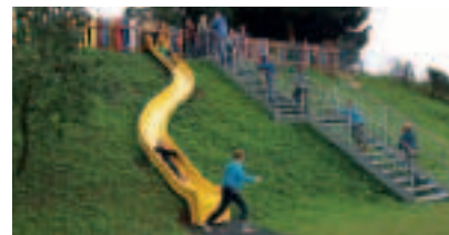
Schleiz - Böttgerschule