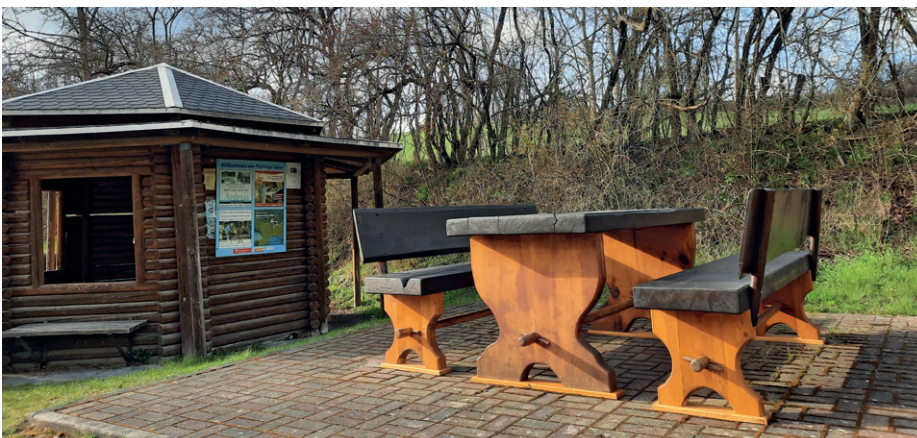
Stetig werden einzelne Sitzgruppen in Schleiz und Ortsteilen erneuert. Diese strahlende Sitzeinheit konnte mit Hilfe der Firma Becher aus Gräfenwarth und dem städtischen Bauhof in diesem Jahr am Wanderparkplatz Gräfenwarth bereits erneuert werden.

Bitte beachten Sie die aktuelle Pandemie-Lage und die damit verbundenen Öffnungszeiten der Einrichtungen.