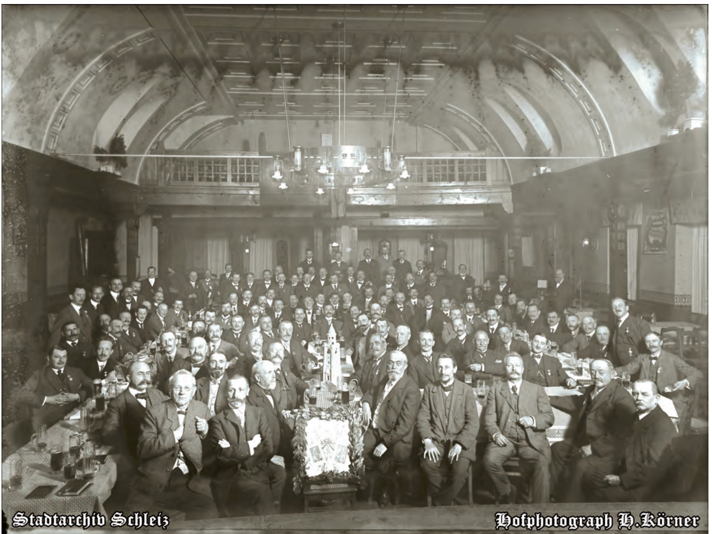
Foto: Schleizer Liedertafel 1914