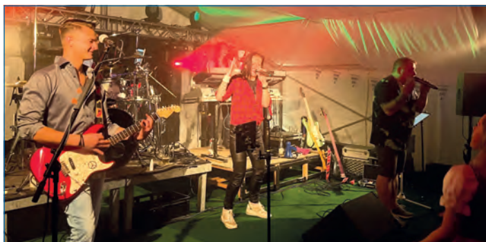
Die Band A9 lud zum Tanzen ein für jung und alt.

Am ersten Oktoberwochenende wurde von Freitag bis Sonntag in Schleiz gefeiert. Es sollte ein Konzept sein für jede Altersklasse: Am Freitag Abend eröffnete die Diskothek Caravan und lud die Jugend zum Feiern ein. Da sich an diesem Tag viele Veranstaltungen in der Region um die Gäste bewarben blieb der erwartete Besucheransturm in Schleiz leider aus. Ganz anders war es am Sonntag, bereits ab der Mittagszeit füllte sich das Zelt auf dem Neumarkt und die Schleizer Innenstadt. Musiker Laudi sorgte bis 17 Uhr für die richtige Stimmung auf dem Schleizer Neumarkt und heizte das Publikum ein.