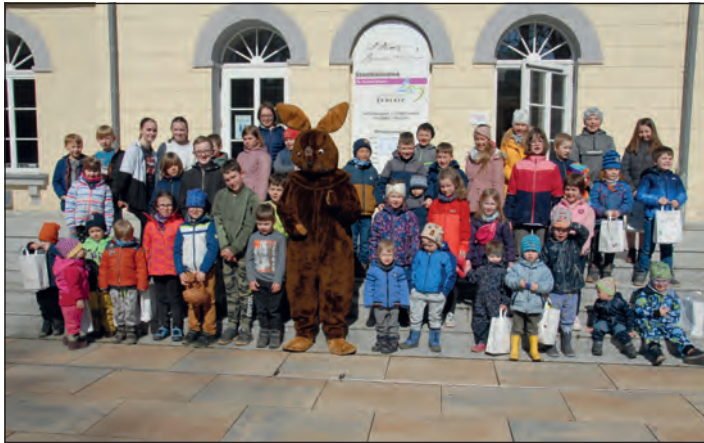
Die Preisträger des diesjährigen Ostermalwettbewerbs des HGV Schleiz e.V.

Online konnten die Eltern ihre Kinder zu diesem Wettbewerb anmelden. Über 70 Kinder haben daraufhin zu Pinseln, Stiften, Schere, Leim und Papier gegriffen und zusammen mit ihren Eltern oder Großeltern gemalt, gebastelt, geklebt und gewerkelt. Herausgekommen sind wahre Kunstwerke: leuchtend bunte Ostereier, Ostereierketten aus Papier, Osterschmuck aus Holz, Perlen oder Wolle.