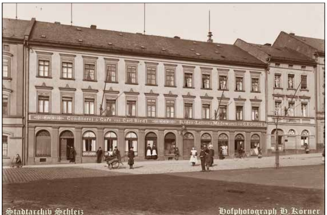
Stadtarchiv Schleiz Hofphotograph W. Körner Cafe Riedl Neumarkt Schleiz um 1910, Hofphotograph Heinrich Körner

Gefunden im Stadtarchiv Schleiz in „Oberland Nr. 15 1925“ von Ingo Möckel