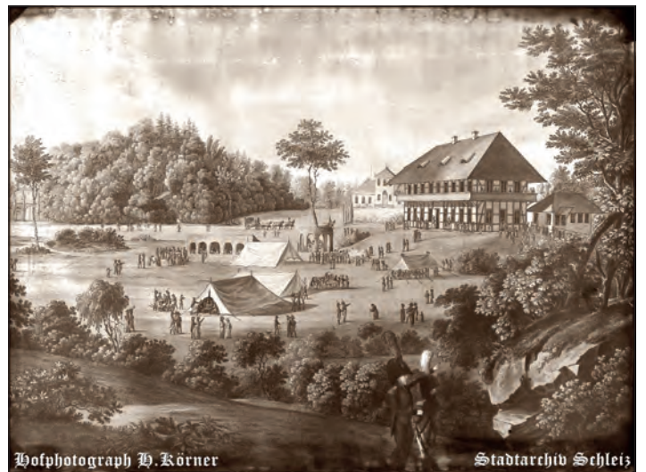
Foto: Gemälde fotografiert von Hofphotograph H. Körner, Schützenfest bei Heinrichsruh um 1810 nach einem ausgemalten Kupferstich von Hammer, gezeichnet von Richter