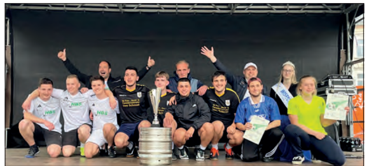
Vom 2. bis 4. Mai fanden auf dem Neumarkt die ersten Schleizer Street-Soccer-Tage statt und begeisterten Zuschauer und Spieler gleichermaßen.