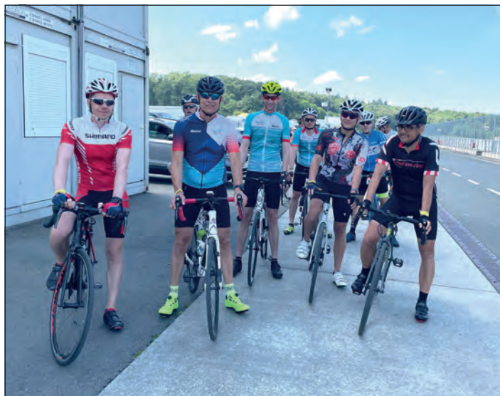
Teilnehmer der Trainingsfahrt 2023