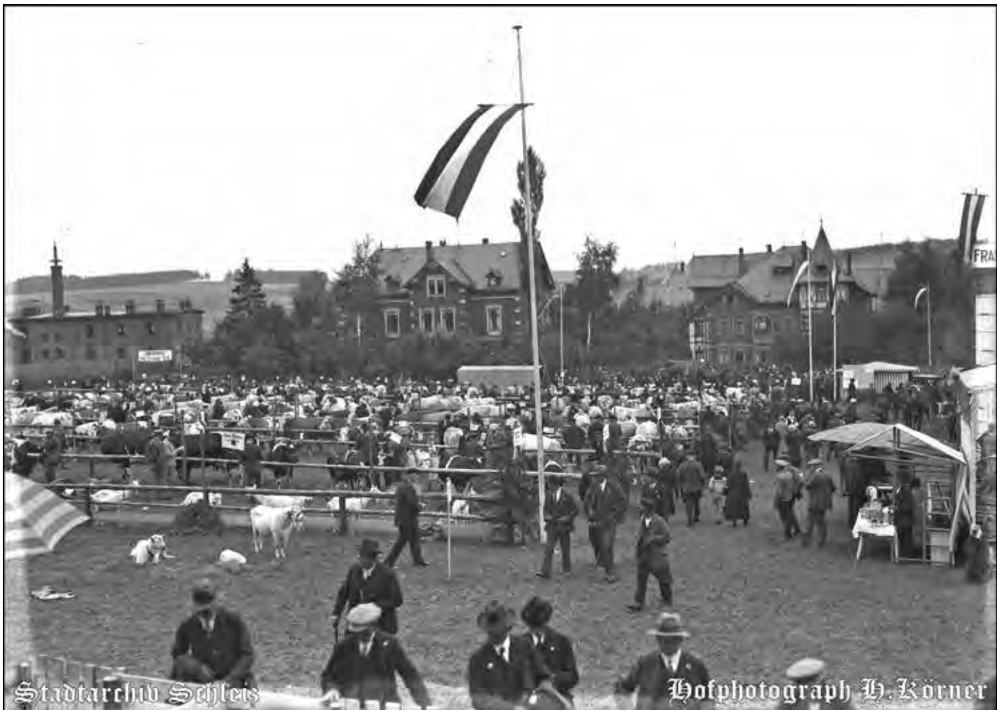
Foto: Stadtwiese mit Viehmarkt