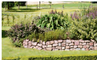
Stromlose Kläranlage PKA ELSA für bis zu 8 Personen.

Auch in diesem Jahr werden HausbesitzerInnen mit der Auflage der Unteren Wasserbehörde konfrontiert, eine vollbiologische Kläranlage zu errichten. Damit setzt das Land Thüringen das Wasserhaushaltsgesetz um. Um die finanziellen Belastungen der BürgerInnen etwas abzumildern, wird es auch in diesem Jahr wieder eine beträchtliche Förderung für den Bau von vollbiologischen Kläranlagen geben. Der Neubau einer Kläranlage für vier Personen wird mit mindestens 2.500 € gefördert. Größere Anlagen werden höher gefördert. Auch der Kanalbau und besondere Aufwendungen aufgrund erhöhter Reinigungsanforderungen werden gesondert gefördert. Die Nachrüstung einer vorhandenen Grube mit einem technischen Nachrüstsatz wird mit 1.500 € gefördert, die Nachrüstung mit einer stromlosen Pflanzenkläranlage PKA ELSA mit mindestens 2.500 €. Damit ist Thüringen das Bundesland mit der höchsten Förderung. Wenn Sie von der Behörde eine Aufforderung zum Bau einer Kläranlage erhalten haben, wenden Sie sich unbedingt an Ihren zuständigen Abwasserzweckverband – oder an die Thüringer Aufbaubank. Lassen Sie sich von einem Kleinkläranlagenanbieter ein Angebot erstellen. Mit dem Angebot und dem entsprechenden Formular der TAB kann dann die Förderung beantragt werden. Bitte bestellen Sie erst ihre Kläranlage, wenn alle Formalitäten geklärt sind! Ansonsten verlieren Sie die Chance auf eine Förderung. Es wird zwischen technischen und stromlosen vollbiologi-