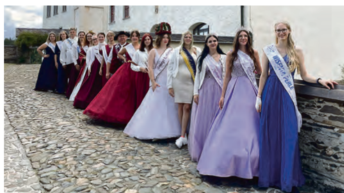
14 Hoheiten bekamen einen kleinen Einblick in die Geschichte von Schloss Burgk.