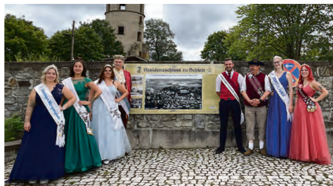
Auch 2024 folgten bereits einige Hoheiten der Einladung zum Hoheitentreffen nach Schleiz.