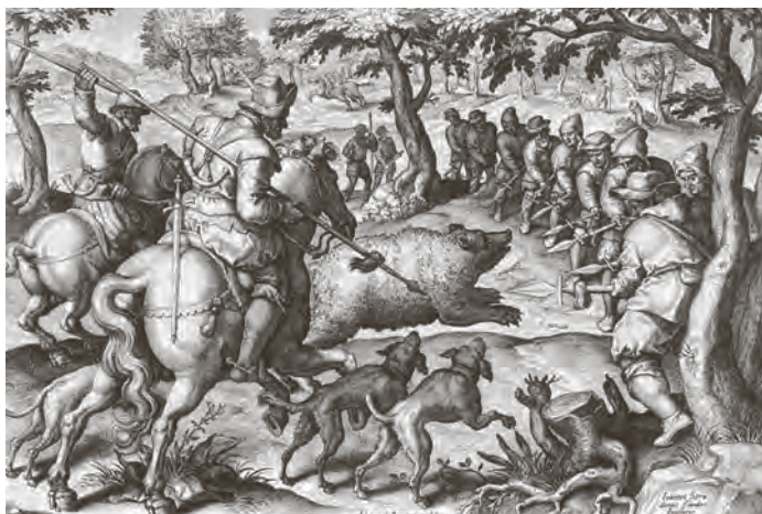
Gefunden im Stadtarchiv Schleiz in Nachlass Günther Wachter von Ingo Möckel

Die Überlieferung, dass in unserer Gegend der letzte Wolf „zu Beginn des 18. Jahrhunderts am Wolfsgalgen“ (bei Oberschitz) erlegt wurde, mag sich auf die Wolfsjagd im Schleizer Wald im Jahre 1703 beziehen, als immerhin 623 Mann aus den umliegenden Dorfschaften aufgeboten und „mit Äxten und der gleichen ausgerüstet und mit Brot für 2 Tage versehen“ waren (nach Behr), es liegt außerdem die Vermutung