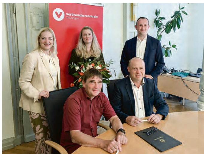
Unterzeichnung des Kooperationsvertrages

Die Beratung kostet 10 Euro. Hier erhalten Sie wertvolle Infos und Musterbriefe. Übernimmt die Verbraucherzentrale für Sie den Schriftverkehr, kostet dies 50 Euro. Schriftverkehr bedeutet, dass die Verbraucherzentrale für Sie Briefe oder E-Mails an den Anbieter formuliert, absendet und auch weitere Schreiben des Anbieters beantwortet.