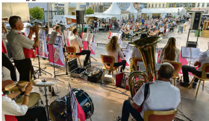
Die Wiesenttaler Musikanten unterhielten die Besucher zum Kloßessen auf dem Neumarkt.

keinerlei Zwischenfälle auf dem Veranstaltungsgelände oder im direkten Zusammenhang mit den Events. Auch die Zusammenarbeit zwischen der Stadt Schleiz, welche Veranstalter am Freitag und Sonntag war, und dem Handels- und Gewerbeverein verlief reibungslos und Hand in Hand. Bedanken möchte sich die Stadt Schleiz bei allen beteiligten Künstlern, Dienstleistern, Caterern sowie bei den Mitarbeitern des städtischen Bauhofs, des DRK, der Sicherheitsfirma, Elektro Hoffmann, den Veranstaltungstechnikern sowie dem Autohaus Fischer für die Bereitstellung des Shuttle-Fahrzeugs für die Künstler am Freitag. Ein herzliches Dankeschön für das gezeigte Verständnis geht ebenfalls an die Anwohner sowie die Gewerbetreibenden rund um den Neumarkt, so dass Lösungen und Kompromisse zur Durchführung gefunden werden konnten.