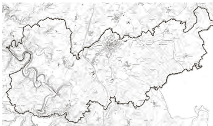
Lageplan des räumlichen Geltungsbereiches Flächennutzungsplan o. M., (Kartengrundlage © Thüringer Landesamt für Bodenmanagement und Geoinformation 2025)