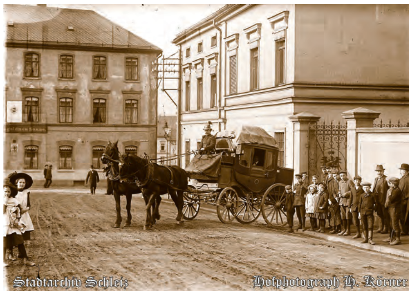
Die letzte Postkutsche fährt aus dem Kaiserlichen Postamt am 31.03.1912.