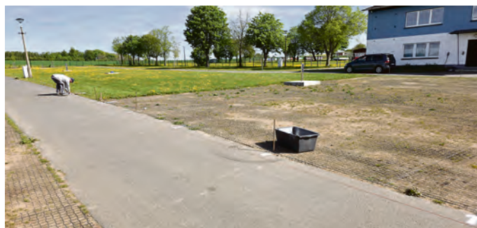
Die Markierungen für die insgesamt 48 Stellplätze wurden aufgebracht.

Weiterhin haben zwei auf Stundenbasis angestellte Hausmeister zur Bewirtschaftung des Geländes ihre Arbeit Anfang Mai aufgenommen. Gesucht wird weiterhin mindestens eine Reinigungskraft auf Minijobbasis mit einer wöchentlichen Arbeitszeit von zehn Stunden. Bewerbungen können direkt an reisemobil@schleiz.de gesendet werden.