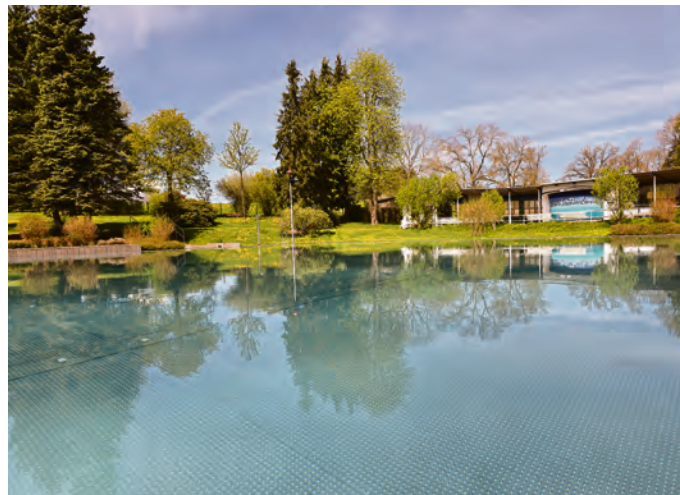
Die neue Saison startet traditionell am 1. Juni und endet planmäßig spätestens am 15. September.

Auch in dieser Saison dürfen sich die Besucherinnen und Besucher auf einige Neuerungen freuen, die den Aufenthalt im Freibad weiter bereichern. Neben zusätzlichen Serviceangeboten wurde auch die Preisstruktur behutsam weiterentwickelt, um den laufenden Betrieb und die Qualität des Angebots langfristig zu sichern. So hat der Schleizer Stadt-